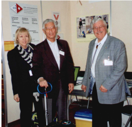
EVS-Stand Palexpo Genf

Bildervortrag: Schweizer Preisträger 2004